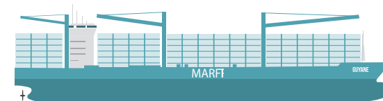
PORTE-CONTENEUR TYPE MARFRET GUYANE 2200 TEUS